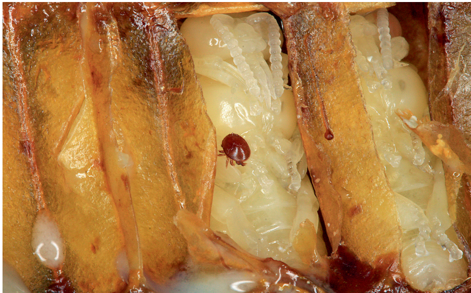
Die meisten Milben sitzen im Sommer in den Brutzellen

Durch die einmalige Entnahme aller Brut sinkt die Zahl der Milben im Volk drastisch. Vermehren sich die Milben anschließend nicht zu stark, erübrigt sich der Einsatz von Medikamenten im Muttervolk.